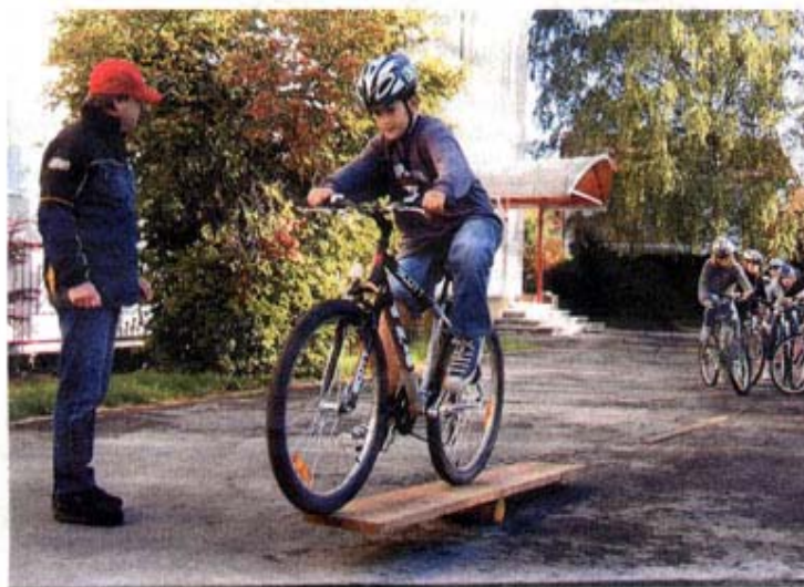
Wichtig, wenn man auf zwei Rädern unterwegs ist: Balancieren und Hindernisse überwinden können